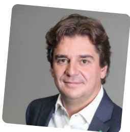
Javier Ayala Alcalde de Fuenlabrada @JavierAyalaO